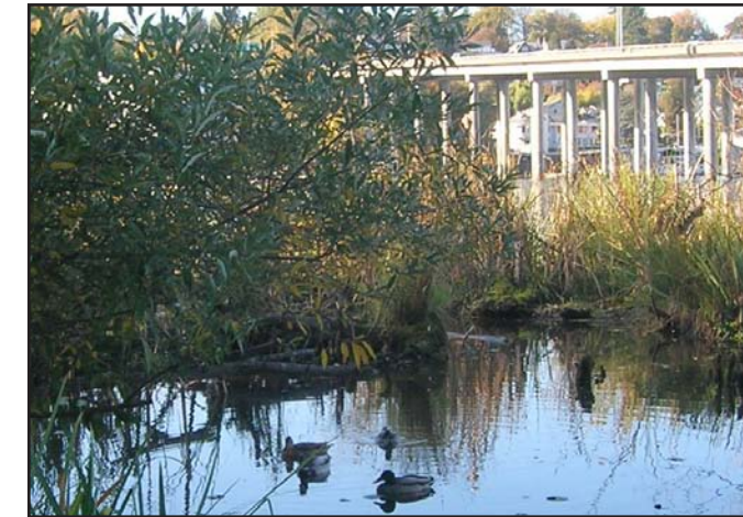
Humedales cerca del puente SR 520.

WSDOT se esfuerza por proporcionar soluciones efectivas para el transporte y minimizar al mismo tiempo los efectos sobre la comunidad y el entorno natural. Cada proyecto del programa SR 520 debe completar documentación ambiental que cumpla las normas ambientales federales y estatales, entre ellas la Ley de Política Ambiental Nacional (National Environmental Policy Act) y la Ley de Política Ambiental Estatal (State Environmental Policy Act). Estas leyes están diseñadas para asegurar que los valores ambientales se integren junto con otros factores en los procesos de toma de decisiones.