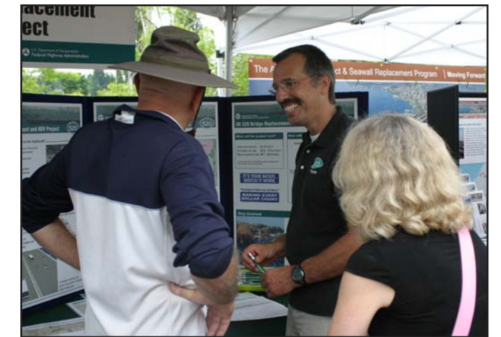
Personal de WSDOT responde preguntas de los visitantes durante un festival local.

Para averiguar más sobre cómo puede participar, por favor vea nuestro calendario de eventos en la página Web del programa SR 520: www.wsdot.wa.gov/Projects/SR520Bridge .